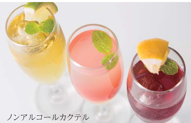
ノンアルコールカクテル