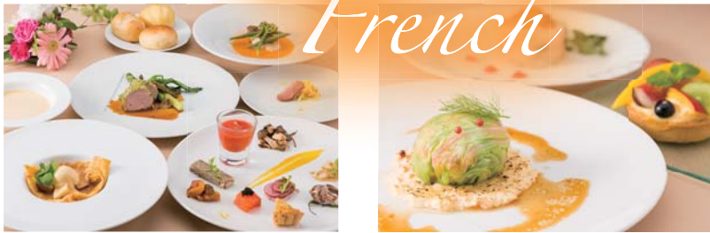
オリジナルフレンチ